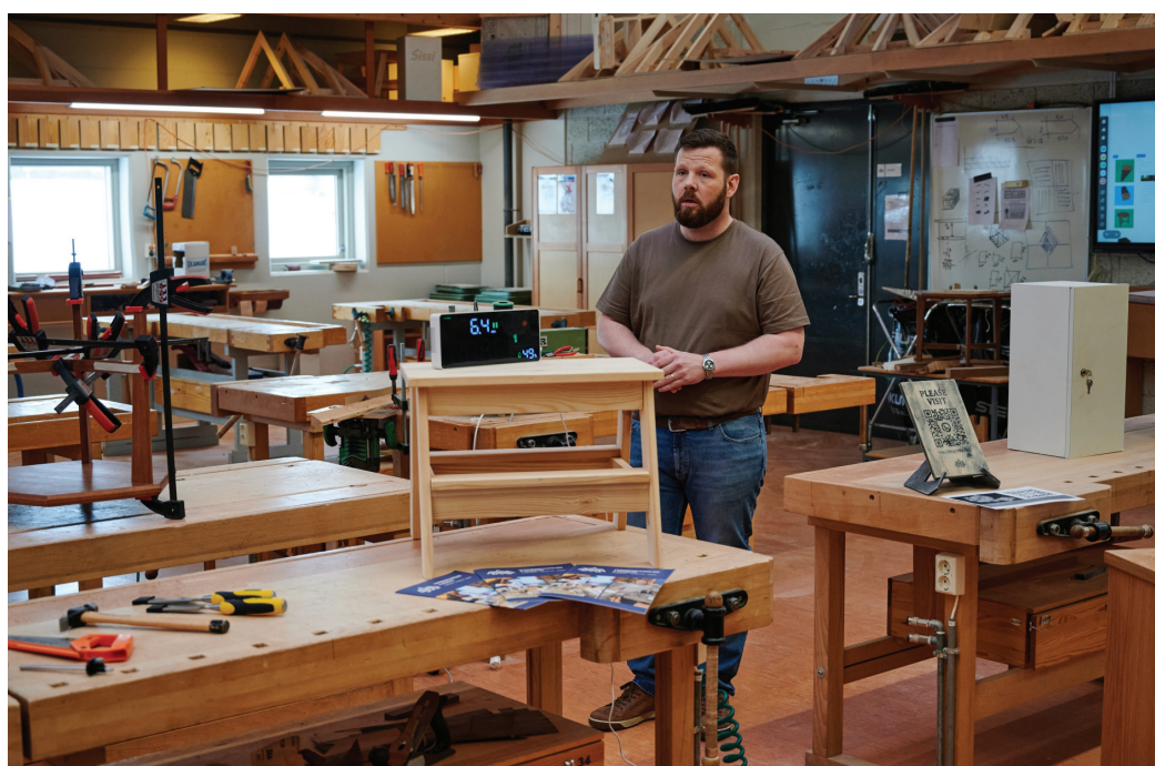
Obisk na Srednji šoli Akureyri, april 2024