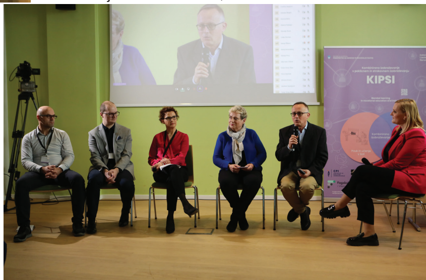
Konferenca Inovativno, kombinirano, uspešno! Ljubljana, marec 2024