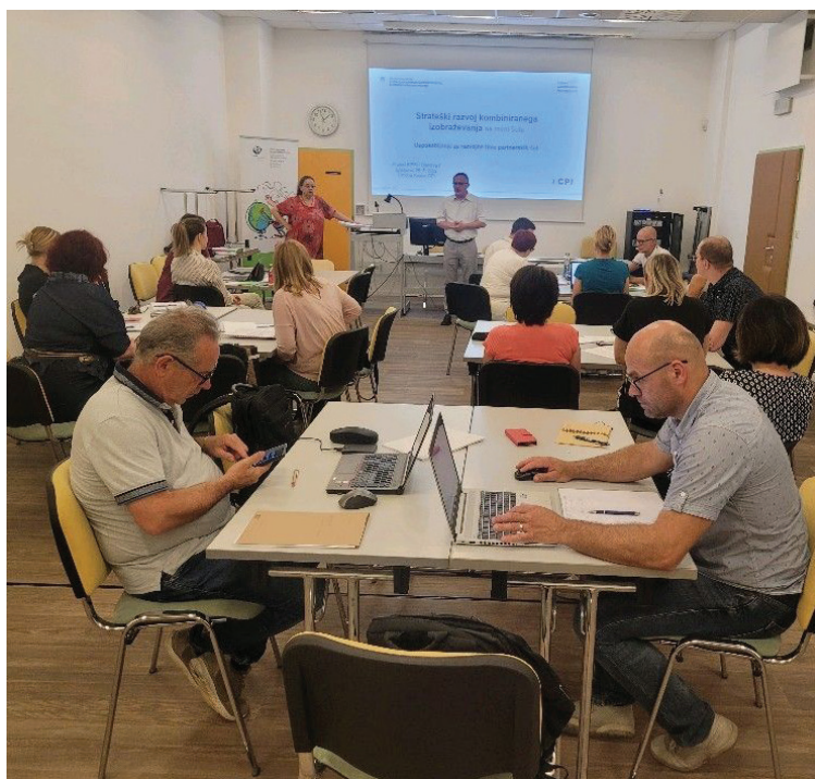
Usposabljanje razvojnih timov slovenskih partnerjev, Ljubljana, 25. maj 2022