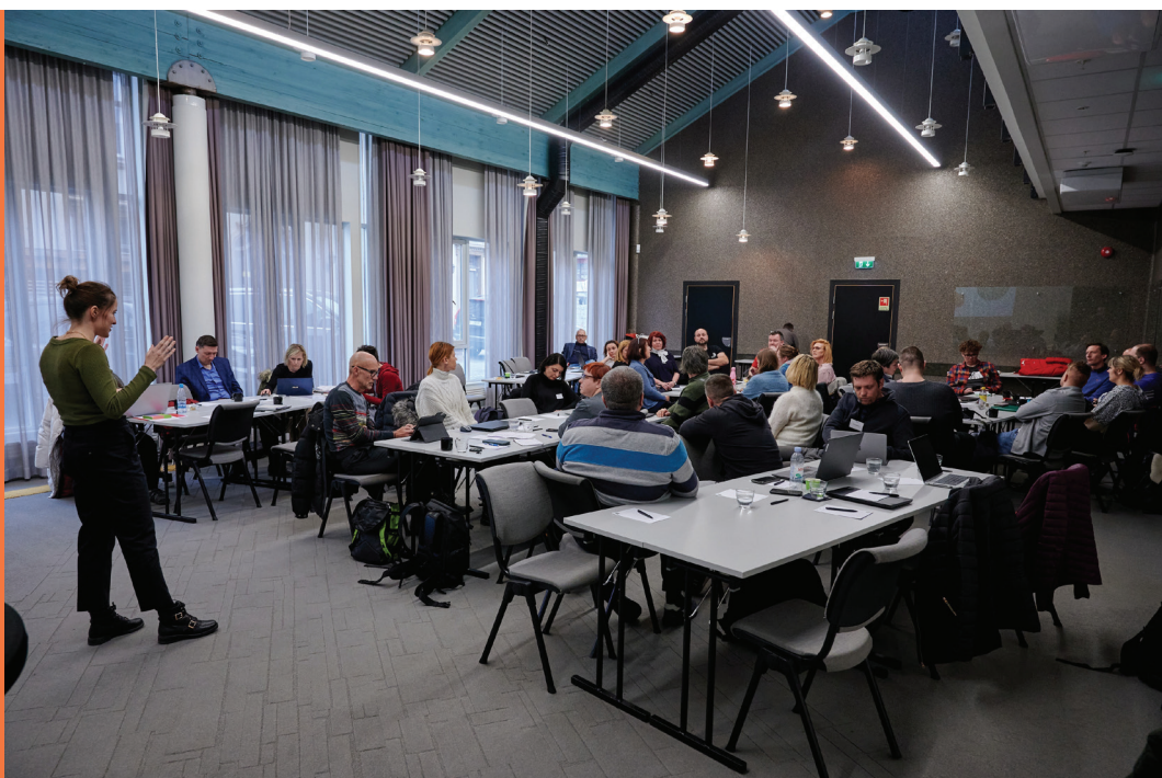
Študijski obisk na Norveškem, 4.–8. april 2022

V aprilu 2022 je potekal prvi od treh študijskih obiskov, načrtovanih v okviru projekta, in sicer na Norveškem, kjer smo obiskali dve partnerski šoli, Srednjo poklicno in strokovno šolo iz Åssidna in Višjo strokovno šolo Viken. Na srednji šoli smo obiskali dijake in učitelje pri pouku v šolskih delavnicah, kjer so nam predstavili, kako so si s pristopi kombiniranega izobraževanja pomagali med epidemijo. Tudi na višji šoli je epidemija spodbudila razvoj izobraževanja na daljavo, čeprav zanje to ni bil povsem nov pristop. Študenti višjih šol na Norveškem so namreč večinoma zaposleni odrasli, ki šolske obveznosti opravljajo ob večerih in vikendih ter v veliki meri na daljavo. Predstavili so nam primere kombiniranega izobraževanja v laboratoriju industrije 4.0 ter pri poučevanju matematike in strokovnih vsebin za bolničarje na višji šoli. Za s strateškim razvojem obarvan študijski obisk so poskrbeli predstavniki vodstev šol, lokalnih deležnikov in partnerske Univerze Østfold.